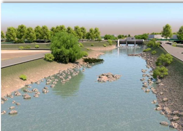
Visuelle Animation Blick Richtung Rietstr./Drosselbauwerk

Der Modellbau durch die technische Versuchsanstalt der TU München wurde im Dezember fertiggestellt. Die ersten Versuche konnten bereits durchgeführt werden. Das Modell wurde im Massstab 1:40 gebaut und wird für technische Optimierungen verwendet. Während dem Mitwirkungs- und Auflageverfahren haben Interessierte die Möglichkeit, das physikalische Modell zu besichtigen. Es werden Carfahrten nach Oberrach zur technischen Versuchsanstalt der TU München organisiert.