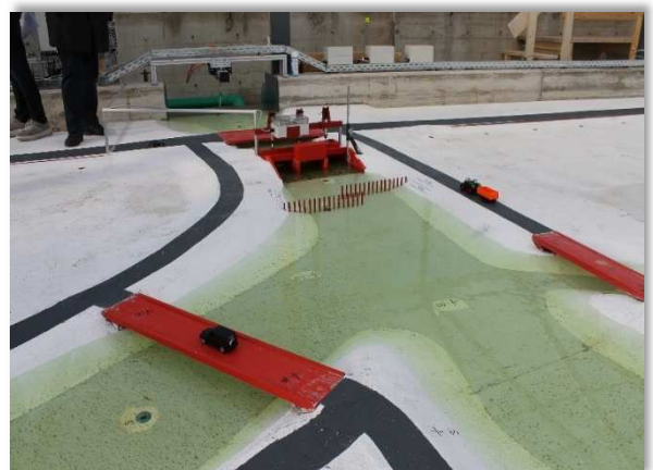
Physikalisches Modell Blick Richtung Rietstr./Drosselbauwerk