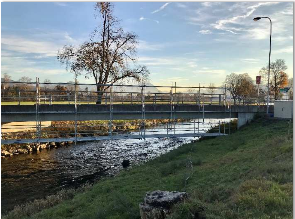
RBK Brücke Altstätterstrasse, Montagearbeiten Messstation Kriessern

Mit der Fertigstellung der Messstelle in Kriessern, die zum Notfallschutzkonzept des Rheintaler Binnenkanals gehört, sind nun alle Anlagen des RBK in Betrieb um frühzeitig vor Hochwasser zu warnen. In Rüthi konnten die Alarmpegel der Messstelle Rüthi auf die neuen Gegebenheiten angepasst werden.