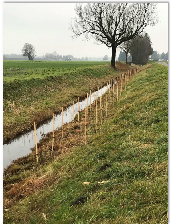
Südlich Montlingen Loseren, Heckenbepflanzung ca. 50 m