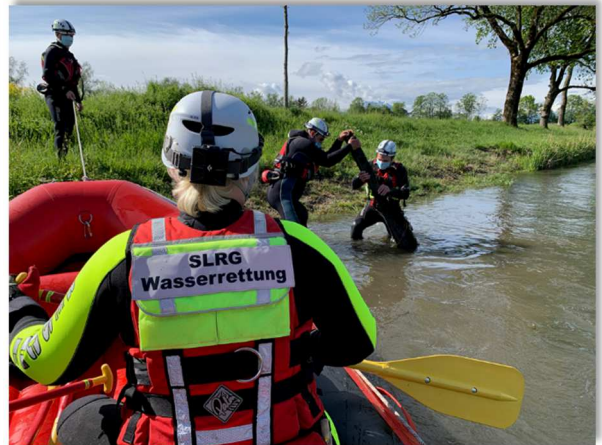
Beseitigen von grösseren Hindernissen