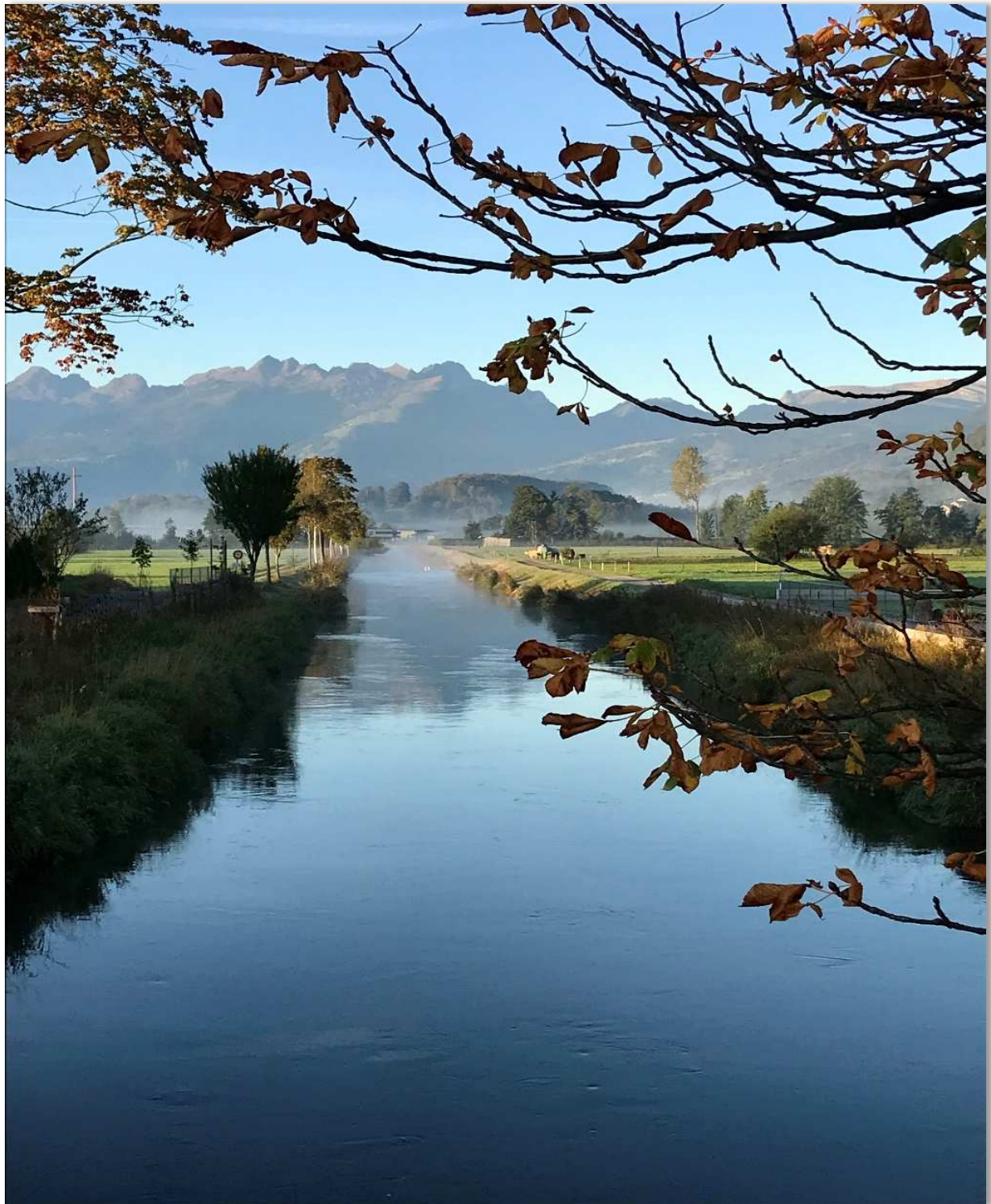
RBK Brücke Bahnhofstrasse, Rüthi Blick Richtung Sennwald im Oktober 2021