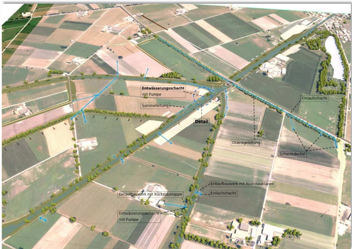
Visuelle Animation Gebiet Rückhalteraum bei Dreibrücken mit Entwässerungsmassnahmen