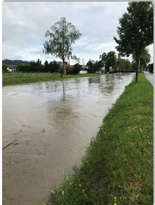
Hochwasser Widnau Dorf nach Sternenbrücke