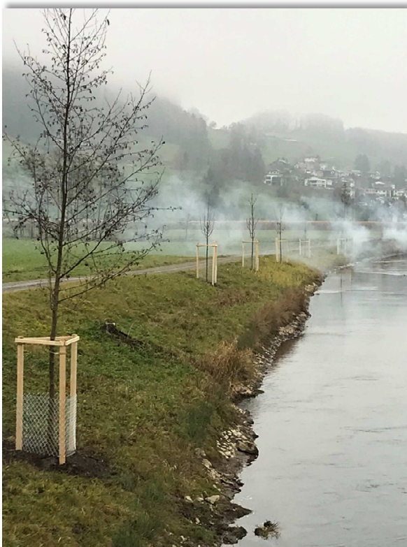
Alleebäume, südlich von Rüthi

Insgesamt wachsen entlang dem Binnenkanal innerhalb der genannten Buschgruppen 300 Setzlinge und 54 neue Bäume in die Höhe. Von diesen Bäumen stehen 37 zwischen Sennwald und Rüthi. In diesem Bereich war der Baumbestand vergleichsweise dürrtig. Die restlichen 17 Bäume befinden sich auf der Strecke Au bis Montlingen. Auf dieser Strecke wurden grössere leere Abschnitte mit Jungbäumen ergänzt.