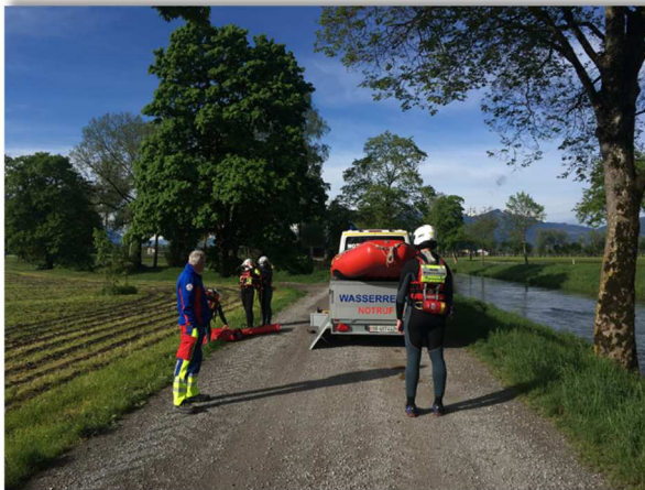
Wasserrettung beim Abladen des Funyaks

Die SLRG Sektion Mittelrheintal verfügt über eine Einsatzmannschaft, die für Wasserrettungen in die kantonale Alarmorganisation eingebunden ist. Aufgrund der positiven Rückmeldungen im Jahr 2020 waren auch im 2021 die Mitglieder der Einsatzmannschaft in Form von Präventionspatrouillen entlang dem Rheintaler Binnenkanal anzutreffen. Dabei sensibilisieren sie die Bevölkerung in Bezug auf die Wassersicherheit. Sie weisen auf Gefahren hin, führen Präventionsgespräche und geben Informationsmaterial ab. Die Patrouillen sind hauptsächlich auf dem Landweg zu Fuss und/oder mit Einsatzfahrzeugen unterwegs.