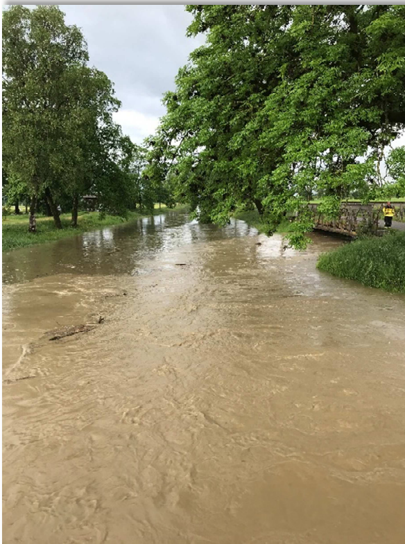
Hochwasser Dreibrücken Richtung Rietaach

Das Ingenieurbüro Bänziger Kocher, das für den Kanton St.Gallen die periodischen Abflussmessungen am Gerinne vornimmt, wurde vom Zweckverband beauftragt, die Abflussmessungen an den Messstationen des RBK durchzuführen. Im vergangenen Jahr konnte bei einem sehr hohen Pegel an der Messstelle Widnau eine Abflussmessung bei Hochwasser erstellt werden. Solche Messwerte sind sehr hilfreich um die P/Q Beziehung (Beziehung zwischen der Abflusshöhe (m.ü.M.) und der Wassermenge ( \text{m}^3/\text{s} ) zu überprüfen und um die Messgenauigkeit der Anlagen zu verbessern. Bei jeder Änderung im und am Gerinne, wie z.B. Veränderung der Flusssohle durch Hochwasser oder Lettenabtrag, wird der Abfluss beeinflusst. Durch die Messhäufigkeit werden die Messabweichungen ausgeglichen und die Pegelmessanlage wird genauer. Das heisst, je älter eine Messanlage ist, desto genauer misst diese, sofern die jährlichen, periodischen Abflussmessungen durchgeführt werden.