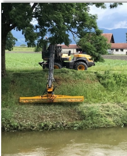
Mäharbeiten mit dem Mecalac

Der Verwaltungsrat hat beschlossen, die Vorgaben des Bundes sofort umzusetzen und die Böschungen, so weit als möglich, nur noch zu mähen und nicht mehr zu mulchen. Damit werden die Kleinlebewesen geschont und gleichzeitig werden mit dem Abführen des Mähgutes die Böschungen über die Jahre ausgemagert. Die Kosten sind rund ein Drittel höher und wurden im Budget 2020 berücksichtigt.