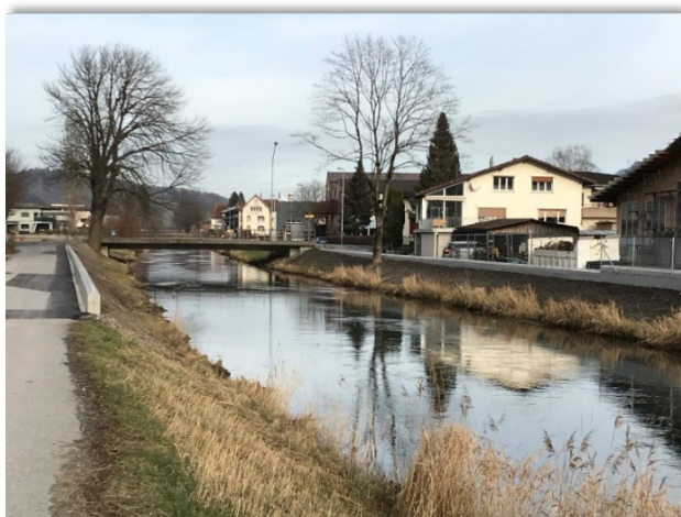
Fertig gestellte Hochwasserschutzmauer in Rüthi

Der Kostenanteil für den Zweckverband beläuft sich auf Fr. 238'089.50, die Investition wird ab 2022 in den kommenden 50 Jahren abgeschrieben.