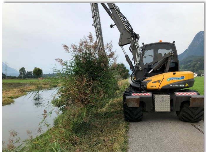
Das Gras wird an der Böschungskante getrocknet und abgeführt