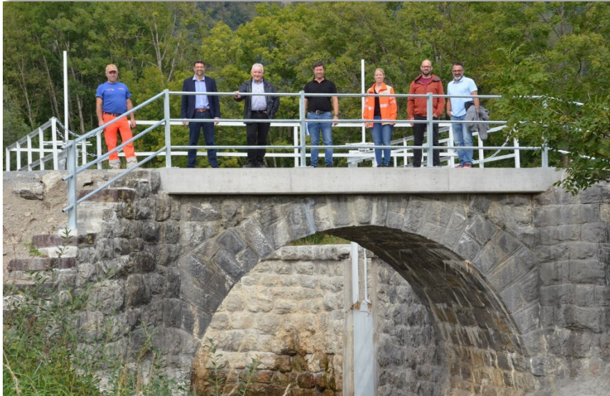
Neue Brückenplatte über dem bestehenden Bogenbauwerk

Die Bypassleitung am Steinenbachsämmler wurde 2019 fertiggestellt. Am 1. Juni wurde mit den Arbeiten an den Brücken begonnen. Es wurden nur Arbeiten ausgeführt, die ausserhalb des Gewässers möglich waren, da bis zum 1. Juli die Schonzeit für Amphibien gilt. Die Bauarbeiten gingen zügig voran und konnten trotz der zwei Hochwasserlagen, welche die Arbeiten einschränkten, Ende September fertiggestellt werden. Es konnten 2'900 m 3 Sedimente entfernt werden. Die Gesamtkosten beliefen sich auf Fr. 387'518.80, diese Investitionen werden nun in den kommenden 50 Jahren abgeschrieben.