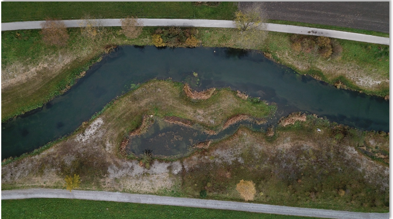
Drohnenaufnahme nördlicher Teil Revitalisierung Rüthi

Mit diesen Massnahmen wird für den Abschnitt ein Mehrwert geschaffen. Gleichzeitig werden die Pflegeschritte für diesen Abschnitt auf ein Minimum reduziert.