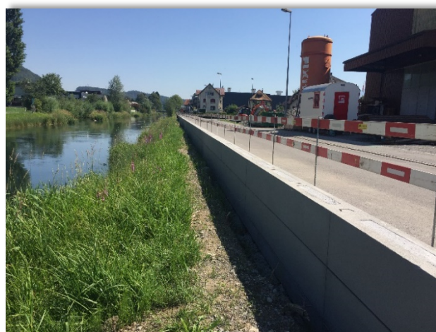
Bauphase Erstellung der Hochwasserschutzmauer