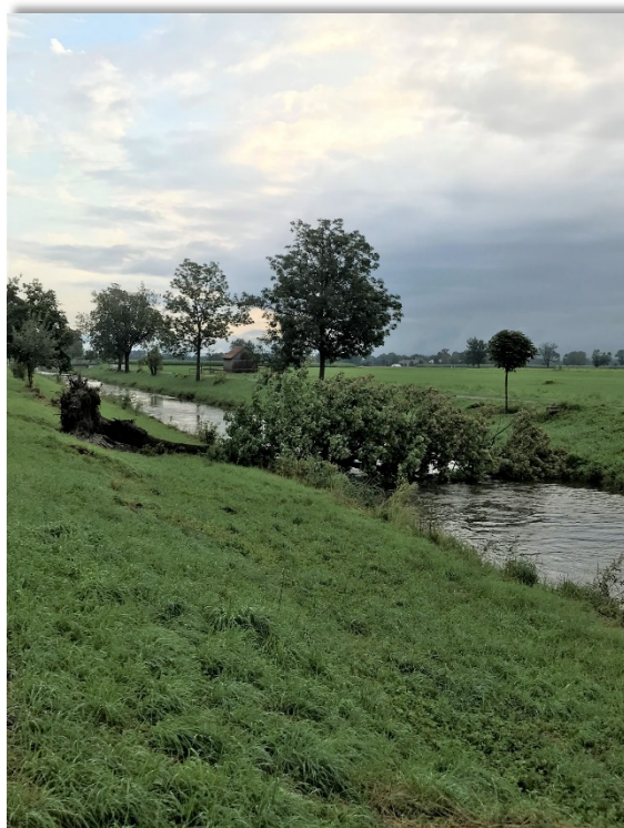
Kriessern bei Altstätterstrasse/Kriessernstrasse