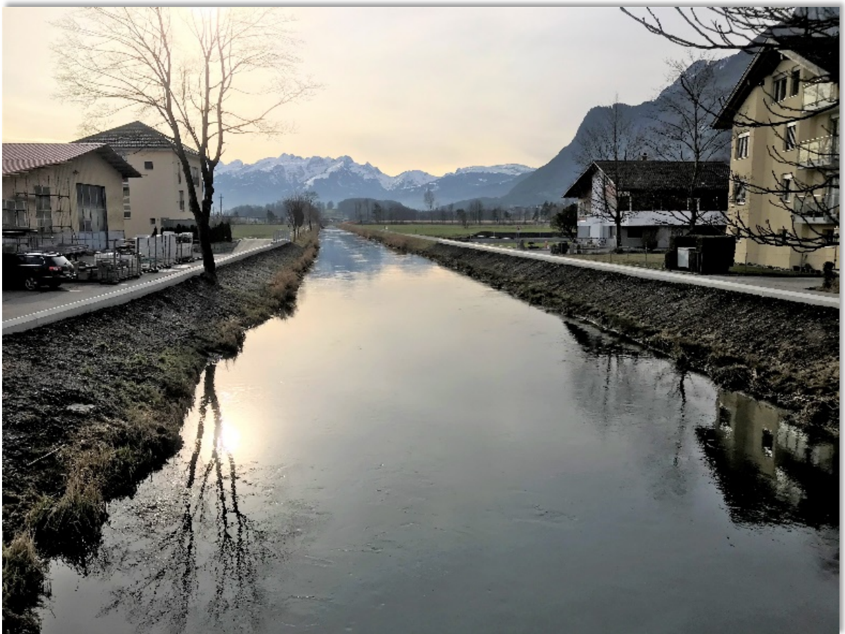
RBK Brücke Bahnhofstrasse Blick Richtung Sennwald Hochwasserschutz, Rüthi

Mit der Fertigstellung des Hochwasserschutzes in Rüthi, konnten die Alarmpegel der Messstelle Rüthi auf die neuen Gegebenheiten angepasst werden.