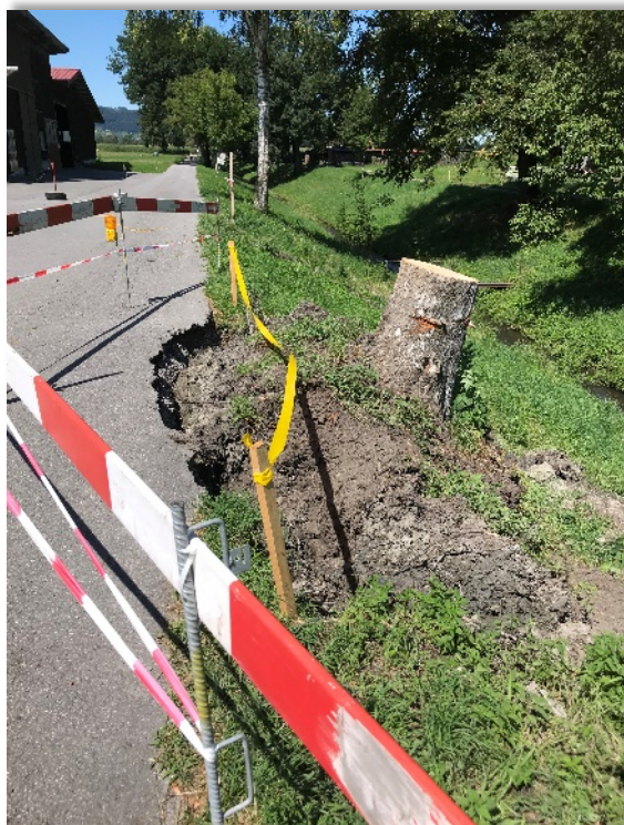
nördlich von Kriessern, der Asphalt wurde auch beschädigt

Ende Juli wurden am Zapfenbach bei einem Sturm, auf einem kurzen Abschnitt von einigen 100 Metern, acht Bäume entwurzelt.