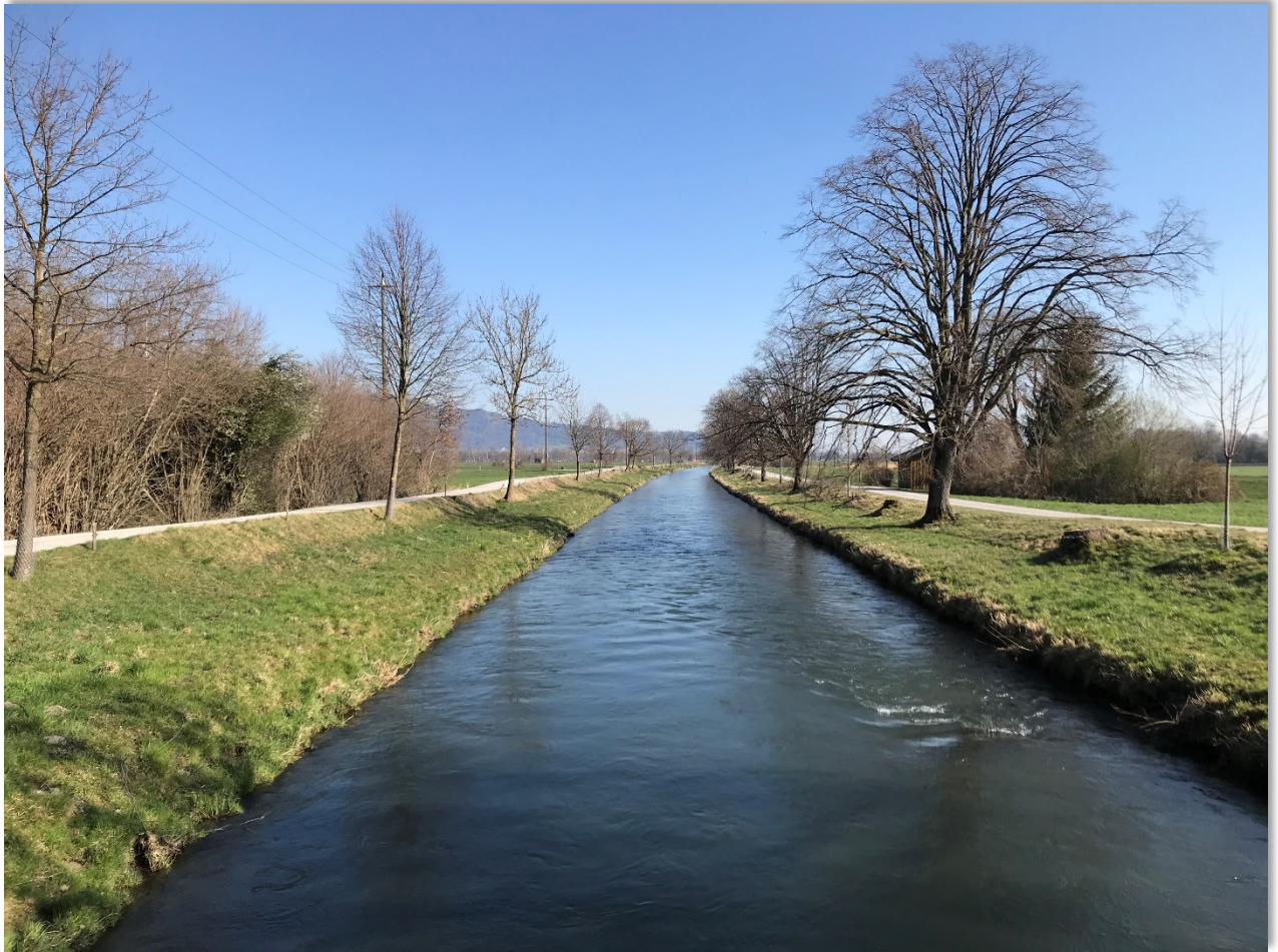
RBK Brücke Ochsengasse Blick Richtung Kriessern im März 2020