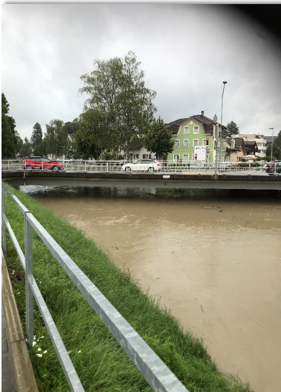
Hochwasser Post Widnau

P/Q Beziehung = Beziehung zwischen der Abflusshöhe (m.ü.M.) und der Wassermenge ( \text{m}^3/\text{s} ).