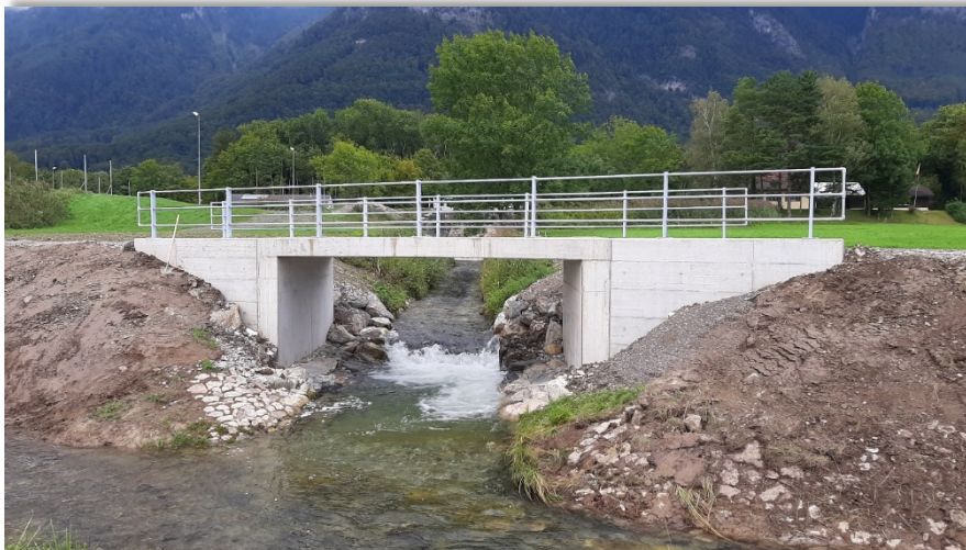
Neubau Parallelbrücke Einmündung Steinenbach in den Binnenkanal