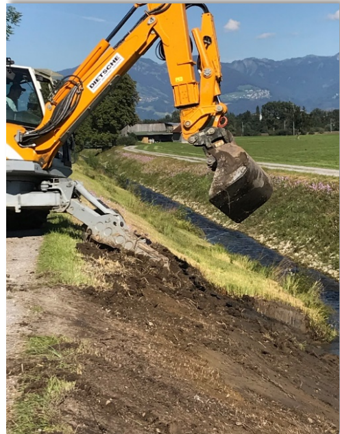
Auf der anderen Uferseite Lettenabtrag aus dem Vorjahr